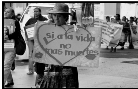
Manifestación para el Día Internacional de la Eliminación de la Violencia Contra la Mujer, Ciudad de Guatemala, el 25 de noviembre de 2007.

sentido, y tomando las palabras de Marcela Lagarde, descastada feminista mexicana, se puede decir que "el feminicidio se ampara en la impunidad, y en él concurren de manera criminal, el silencio, la omisión, la negligencia y la colusión de autoridades encargadas de prevenir y erradicar estos crímenes". 7