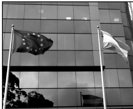
Banderas afuera del edificio de la delegación de la Comisión Europea en Guatemala.

La red iniciativa de Copenhague para Centroamérica y México (CIFCA) junto con el Grupo Sur organizó una Conferencia el 3 y 4 de mayo de 2006 en Bruselas con el objetivo de aunar voluntades colectivas de ambas regiones, argumentando que otro modelo de Acuerdo de Asociación no sólo es posible sino necesario. Un acuerdo que, según CIFCA, esté basado en el principio de no reciprocidad y tratamiento especial y diferenciado. Para CIFCA, la demanda de una dimensión social de la integración centroamericana es inherente al progresivo logro de una cohesión