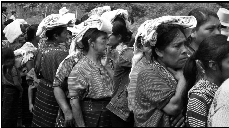
Mujeres esperando para registrarse durante la consulta popular en San Sebastián, Huehuetenango, en Octubre de 2007.