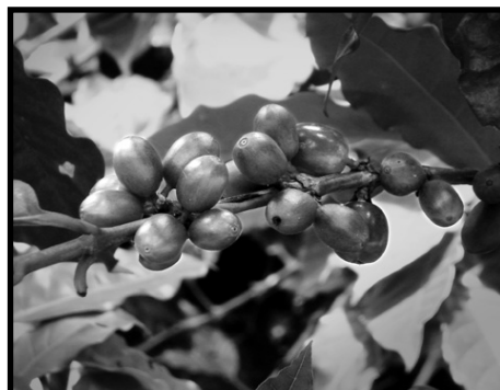
Café madurándose en el árbol.

La motivación que más me da, o la fuerza espiritual que uno tiene, es que desde el año 1990 hemos venido escuchando los textos bíblicos, y uno de estos me motivó bastante, es el texto que dice: "tuve hambre y no me diste de comer, estuve desnudo y no me cubriste, estuve en la cárcel y no me fuiste a ver, estuve enfermo tampoco me..." Entonces este texto bíblico me hizo pensar que Jesús