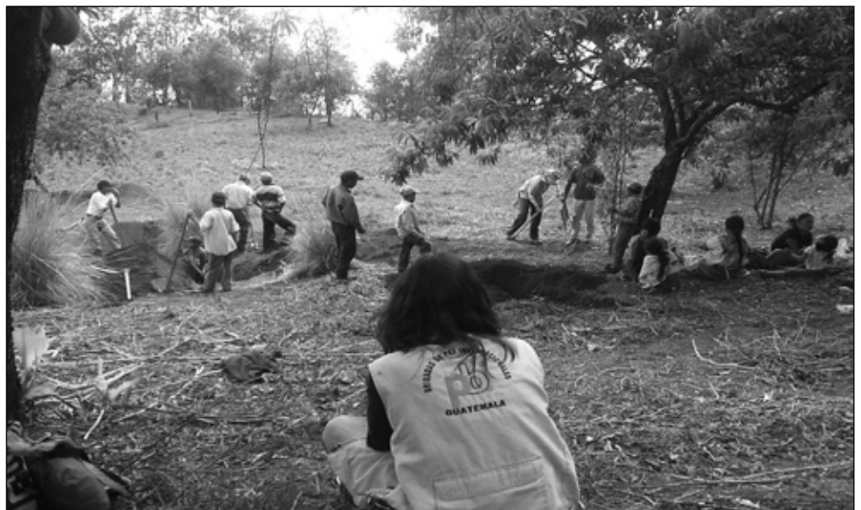
Acompañamiento a CONAVIGUA durante una exhumación en Buena Vista, Sacapulas.

El 5 de abril fue anunciado que el día anterior la Corte de Constitucionalidad (CC) había avalado las consultas populares que se hicieron en Río Hondo, Zacapa, y Sipakapa, San Marcos, en junio del 2005 sobre la presencia de hidroeléctrica y minería en la zona. Las consultas mostraron el desacuerdo de la población con la actividad hidroeléctrica y minera en su territorio, resultados que ahora la CC ha declarado válidos. Las consultas fueron fuertemente apoyadas por el Colectivo Madre Selva , y observadas entre otros, por el equipo de PBI. Sin