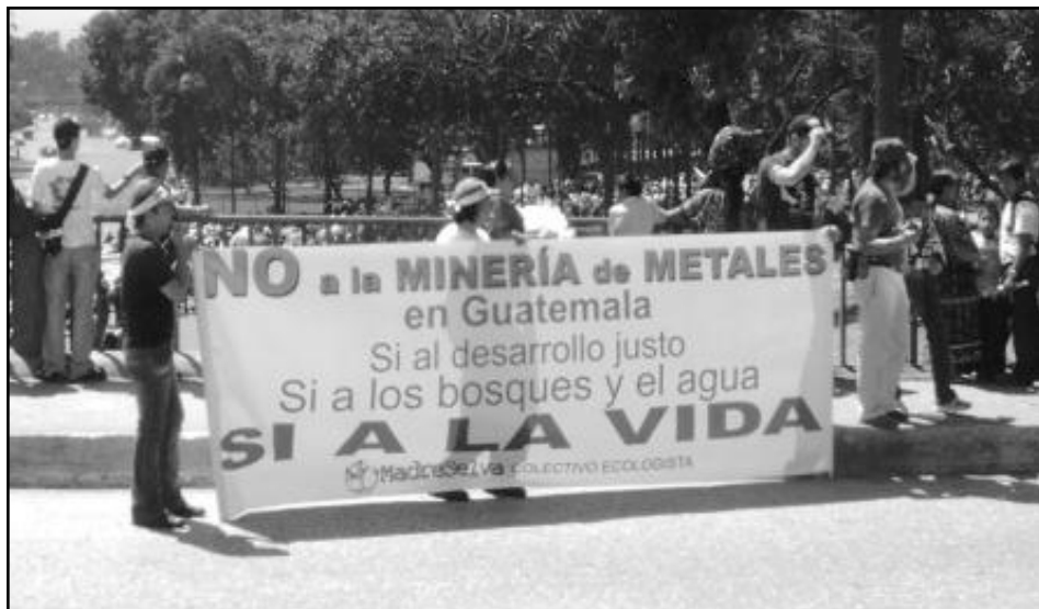
Participación del Colectivo Madre Selva en una manifestación en la capital.