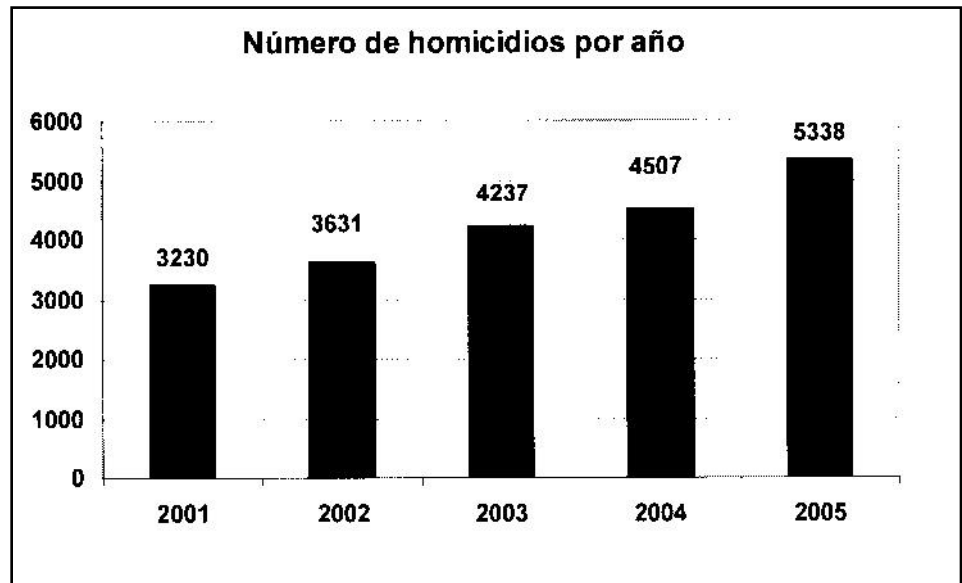
Gráfico llevando el número de homicidios en Guatemala entre 2001 y 2005. PBI

Son las zonas urbanas las más afectadas por la violencia en todas sus manifestaciones, especialmente en el departamento de Guatemala, seguido en gravedad por los de Escuintla, Petén y Quetzaltenango 4 . Independientemente del aspecto urbano que suele hacer de las ciudades una cuna de las peores tasas de violencia 5 , se tiene que destacar la impunidad como el mayor factor que genera cada vez más criminalidad