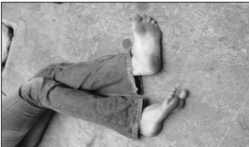
Según algunos activistas sociales, la gran cantidad de presuntos pandilleros que aparecen muertos cada día podría responder a una estrategia de limpieza social.