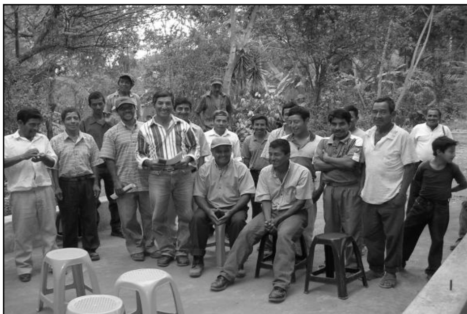
Campesinos despedidos de la finca San Jerónimo y La Fábrica en San Marcos.