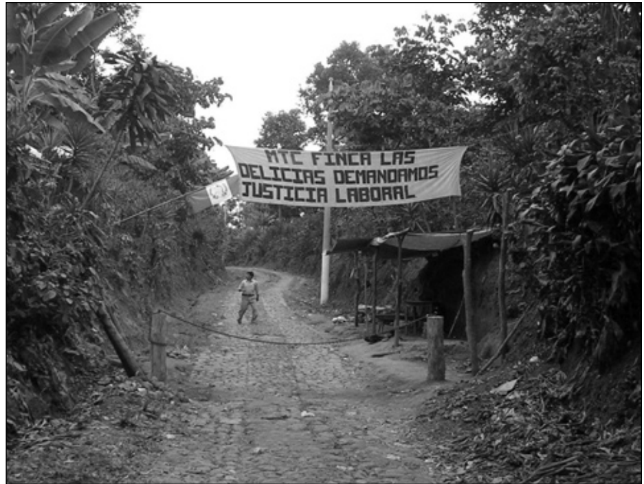
Pancarta del Movimiento de los Trabajadores Campesinos (MTC) en la finca Las Delicias en San Marcos.