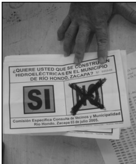
Consulta popular sobre hidroelectricas en Rio Hondo, Zacapa.

La falta de agua se ha convertido en un fenómeno cotidiano y de ámbito nacional.